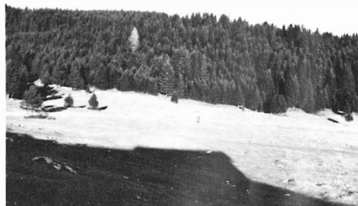
Fig. 2 - Area dei ritrovamenti.