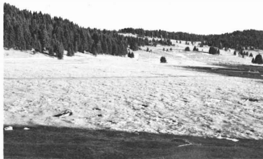
Fig. 1 - Zona di Malga Millegrobbe di Sopra.